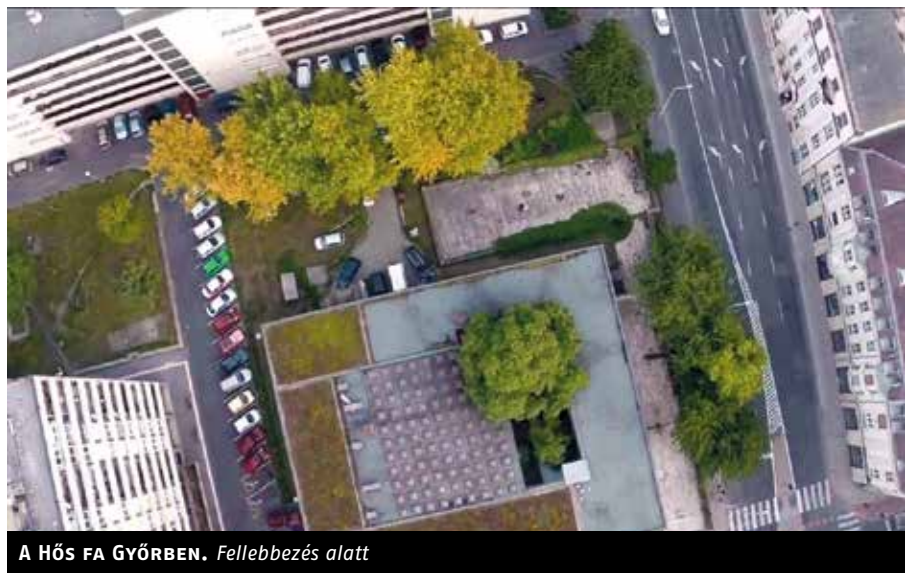
A HŐS FA GYŐRBEN. Fellebbezés alatt

örökséggel. Különösen, ha van üdvösebbnek gondolt célja. Mint amilyen a miniszterelnök és a kormány egy részének felköltözése a Várba, ami – mint azt Lányi András humánökológus december elején egy építészfórumon megjegyezte – „a Városliget betegségének okozója”. A Nemzeti Galéria odatelepítése és a Ligetbe szánt többi kulturális intézmény elhelyezésének megkönnyítése érdekében három fideszes képviselő javaslatára az Országgyűlés két hét alatt elfogadta a Városliget-törvényt, amely rövid úton kiiktatja a kekeckedőket: a Ligetet ellenszolgáltatás nélkül 99 évre állami vagyonkezelésbe adja, kivonja a budapesti agglomeráció területrendezési tervének hatálya alól, a fővárost pedig olyan új építési szabályzat kiadására kötelezi, amely megfelel a Városliget-törvényben előírányzott beruházási céloknak. „Budapest hosszú távú városfejlesztési koncepcióját nem kell figyelembe venni”, és „nem kell alkalmazni” az országban egységes beépíthetőségi szabályokat tartalmazó